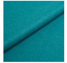
Wooly Plus 2287 Opal 1039019