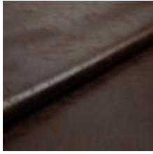
Rodeo 6 Java 1028606