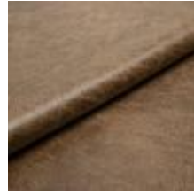
Rodeo 26 Desert 1028626