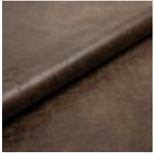
Rodeo 66 Umbra 1028666