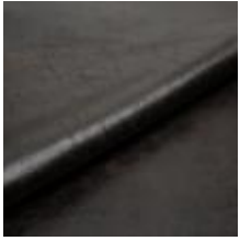
Rodeo 4 Night 1028604