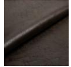
Rodeo 46 Tobacco 1028646