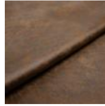
Rodeo 36 Cognac 1028636