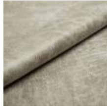
Rodeo 10 Ebony 1028610