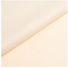
Wooly 1016 bone 1038810