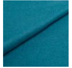
Wooly 2240 petrol 1038822