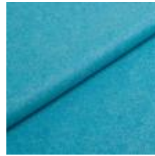
Wooly Plus 0106 Turquoise 1039018