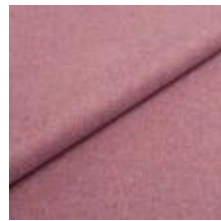
Wooly 2020 lilac melange 1038881