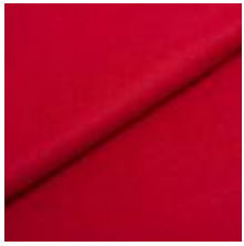
Wooly 2142 raspberry 1038801