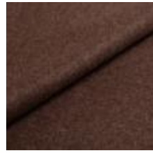
Wooly 1008 brown 1038806