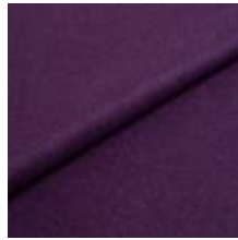
Wooly Plus 0091 Berry 1039017