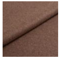
Wooly Plus 9202 Taupe 1039007