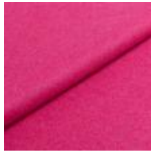
Wooly Plus 9872 Pink 1039016