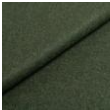
Wooly Trend 840069 Juniper 1039028