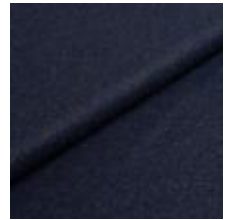
Wooly 1007 navy 1038842