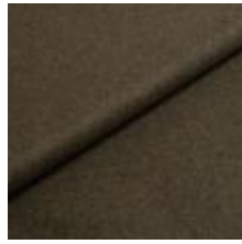
Wooly 1011 bottle green 1038803