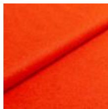
Wooly Plus 9145 Pumpkin 1039010