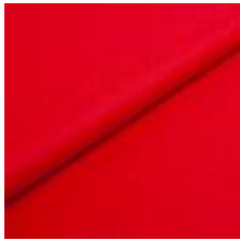
Wooly Plus 2011 B Red 1039015