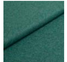
Wooly Trend 842287 Lagoon 1039032