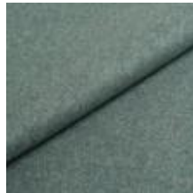
Wooly Trend 228881 Lapis 1039030