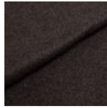
Wooly 1002 koks 1038804