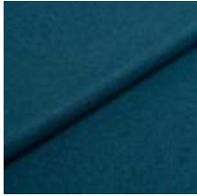
Wooly Plus 2279 Ocean 1039022