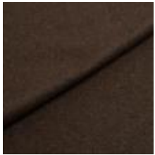
Wooly 1010 forest 1038823