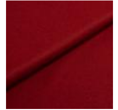
Wooly Trend 2301 Marsala 1039026