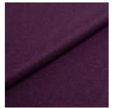
Wooly 2255 dark lilac 1038891