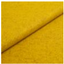
Wooly Plus 2270 Lime 1039001