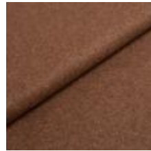
Wooly 1026 light brown 1038836