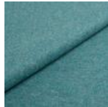
Wooly Trend 22882287 Aquamarin 1039031