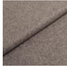
Wooly 1000 light grey 1038817