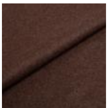
Wooly Plus 1008 B Ebony 1039008