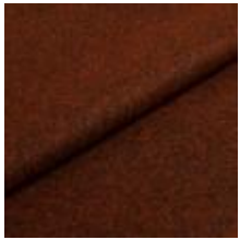
Wooly Plus 2153 Java melange 1039014