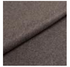
Wooly 1042 grafit 1038807