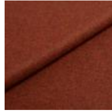
Wooly Trend 380037 Rust 1039025